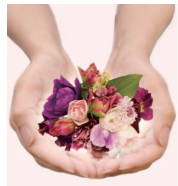
ダイアナ フラワージェンヌ プロジェクト